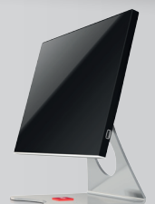
Gewicht 4960 g