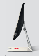
Tiefe 180 mm