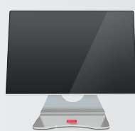
Höhe 324 mm