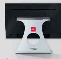
Breite 390 mm